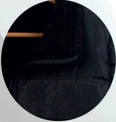
Antipilling havlu polar